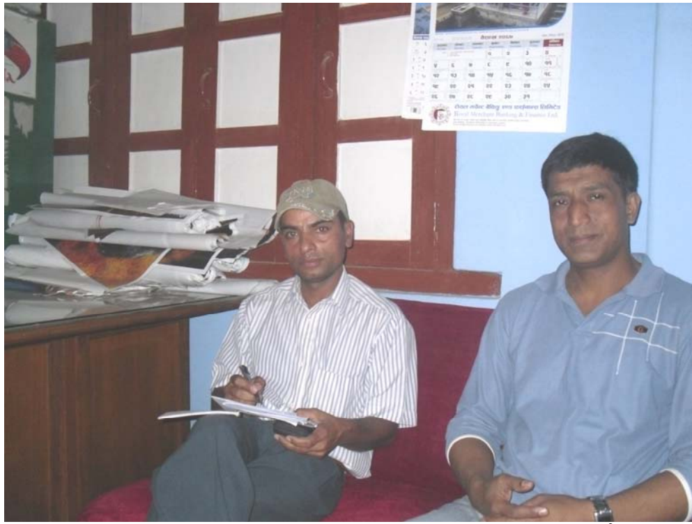
अष्ट नारायण चलचित्र हल, बालाजुका संचालकसँग अध्ययन सम्बन्धी छलफल गर्दै अध्ययन टोली सदस्य