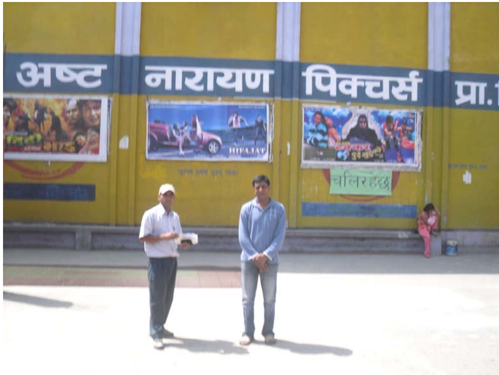
अष्ट नारायण चलचित्र हल, बालाजुमा अध्ययनको क्रममा अध्ययन टोली सदस्य