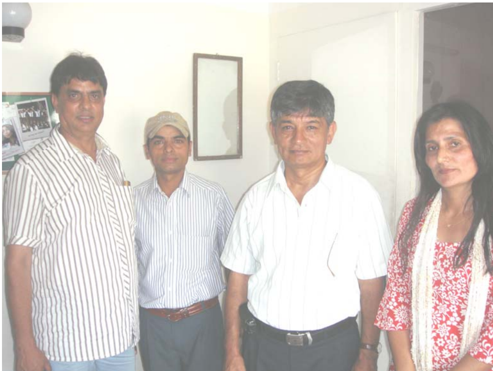
मह जोडीसँग छलफलको क्रममा अध्ययन टोली सदस्यहरु